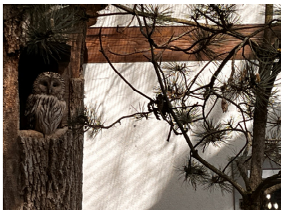
Der Uhu beobachtet uns Besucher.

Die Thuraunen entdecken: Besuch der Ausstellung.