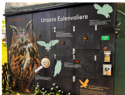
Die Voliere zum Erholen.