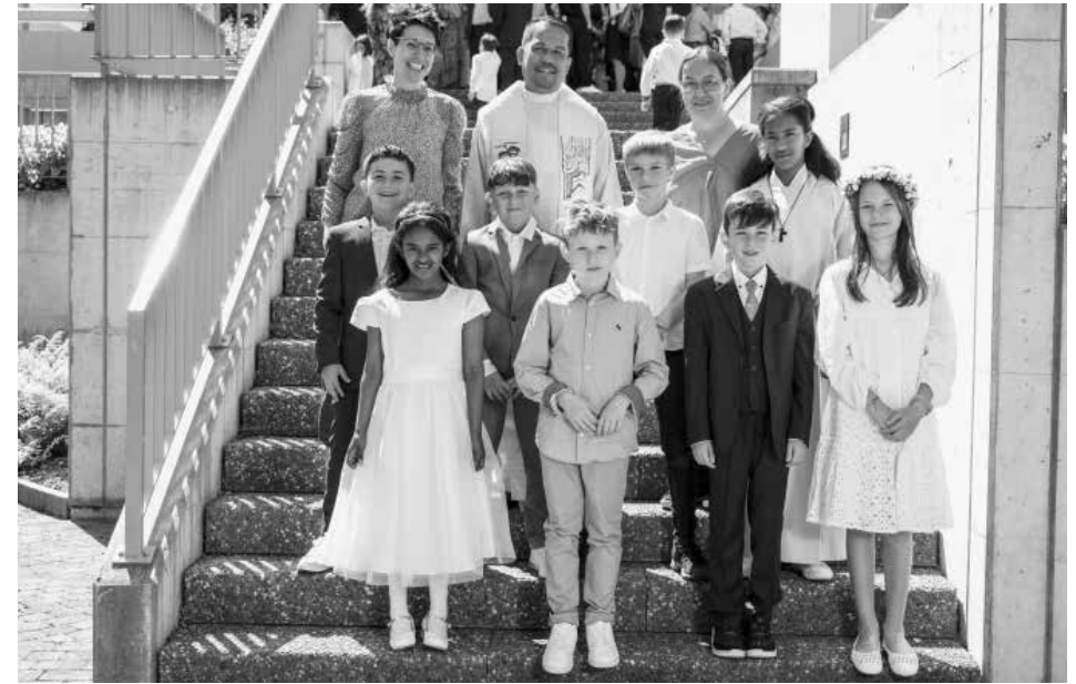
Erste Gruppe Samstag, 14. Mai 2022