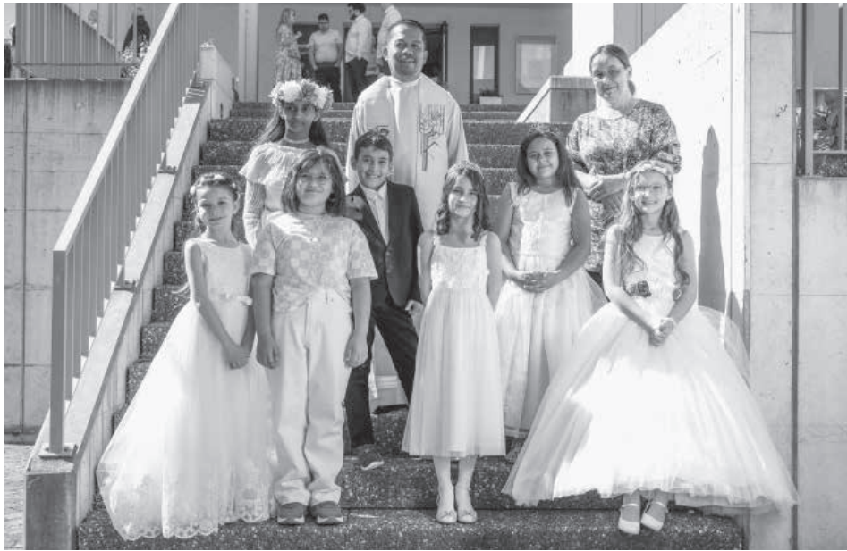
Erste Gruppe Sonntag, 15. Mai 2022