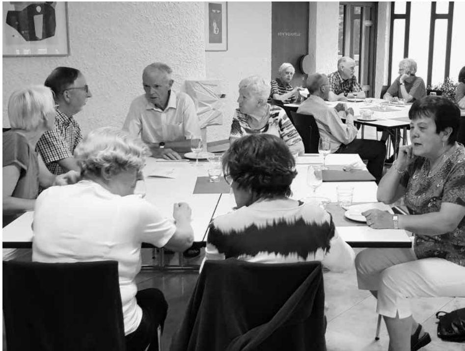
Auch nach der Pfarreiversammlung 2021 konnten wir, dank Corona-Rückgang, Gastfreundschaft üben und pflegen. Ein schönes Beisammensein, das alle sichtlich genossen.

Ich frage noch einmal: Haben Sie gern Gäste?