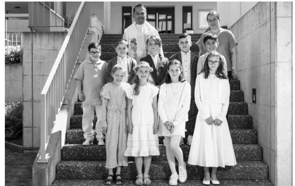
Zweite Gruppe Samstag, 14. Mai 2022