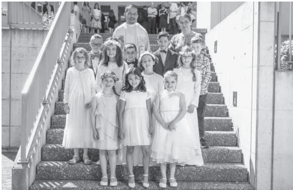
Zweite Gruppe Sonntag, 15. Mai 2022