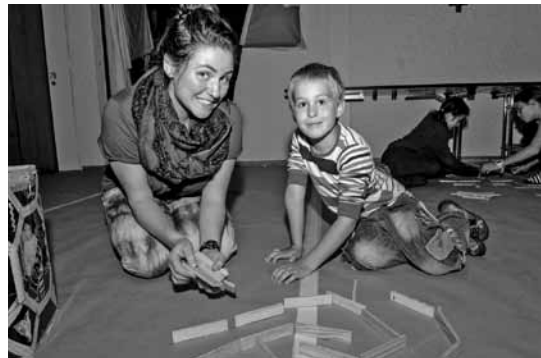
Ob gross oder klein, alle helfen mit, um dem Baum zu helfen.

gab es einen Hinweis, wo sich der Baumflüsterer aufhält. Als die Gruppe ihn schliesslich entdeckte, war der Baumflüsterer einverstanden, sich um den Weltenbaum zu kümmern und begleitete die Gruppe zum Weltenbaum. Über Nacht lernte der Baumflüsterer den Weltenbaum zuerst einmal gut kennen, denn eine Diagnose kann der Baumflüsterer erst stellen, wenn er den Baum richtig gut kennt. Am nächsten Morgen waren alle ganz gespannt, was der Baum-