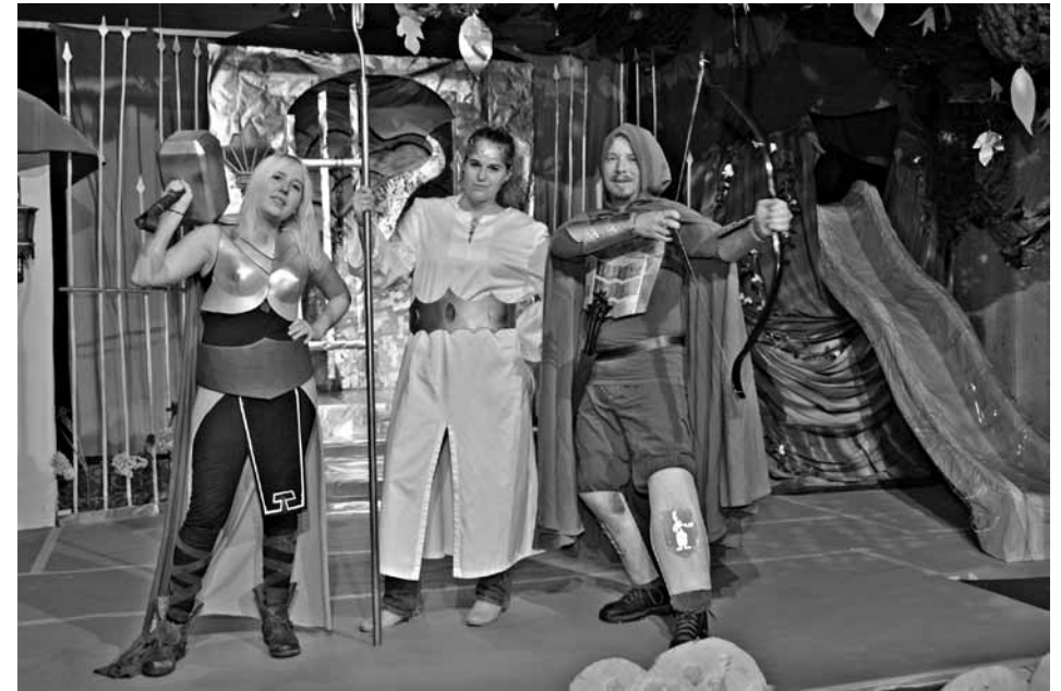
Thor, Heimdall und Mörkolas geben ihr Bestes, um in den Welten des Weltenbaums für Ordnung zu sorgen.

flüsterer zu erzählen hat. Doch die Verständigung gestaltete sich als etwas schwierig, da der Baumflüsterer sich so langsam bewegte und sprach, dass er dabei selbst alle paar Minuten einschief. Dank dem Zaubertankmixmeister gelang es einen Trank zu brauen, sodass der Baumflüsterer etwas auf Trab kam. Er erzählte nun, dass der Baum sehr traurig sei, weil ihn niemand richtig wertschätzt und zu allem Übel habe die tollpatschige Thor noch ihren schweren Hammer auf eine Wurzel fallen lassen und den Baum dadurch so sehr verletzt,