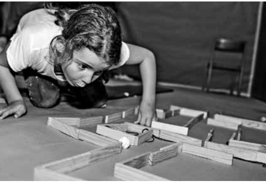
Der Samen muss so schnell wie möglich durch das Labyrinth gepustet werden.

dringend etwas unternommen werden musste. Also half jeder tatkräftig mit, um den Baum gesund zu pflegen. Beispielsweise pusteten sie wertvolle Baumknospen durch ein Labyrinth oder bastelten kleine Helferzwergelein. Während alle auf ein Zeichen der Genesung des Baumes warteten, wurde viel gesungen, gebastelt, gezeichnet, gespielt und Briefe geschrieben, welche dann von den Baumbriefträgern verteilt wurden. Doch trotz den vielen Bemühungen wurde der Baum nicht gesund. Dem Waldelf Mörkolas kam in den Sinn, dass in den Tiefen seines Waldes ein Baumflüsterer lebt, der mit Bäumen sprechen und so erfahren kann, wie es ihnen geht und wo ihnen die Wurzel drückt. Also machten sich alle Kinder, Leiterinnen und Leiter sowie Heimdall, Thor und Mörkolas auf den Weg in den Wald, um diesen sagenumwobenen Baumflüsterer zu finden. Doch da dieser nicht so einfach gefunden werden kann, mussten die Kinder noch einige Aufgaben lösen. Für jede erfolgreich erledigte Aufgabe